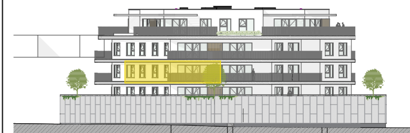
Façade Angle de l'avenue Alphonse Allard et Petite Rue à l'Art